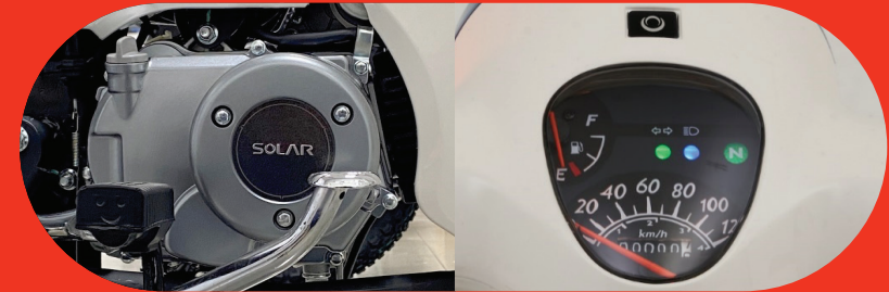
เครื่องยนต์ 125 CC